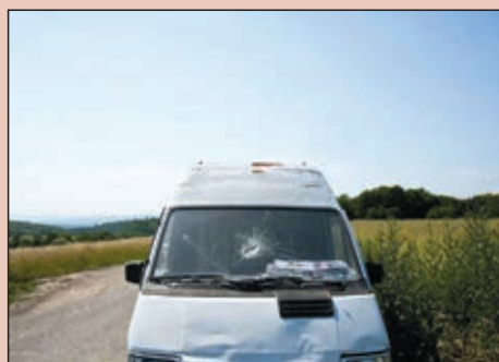
No es un trabajo